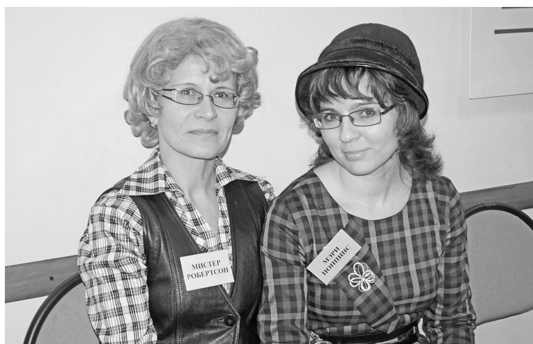
«Мистер Робертсон» и «Мэри Поппинс».